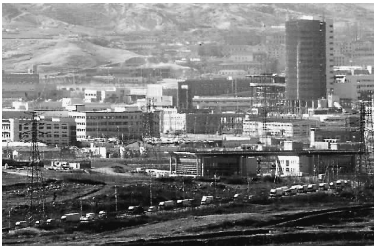
图为开城工业园区。